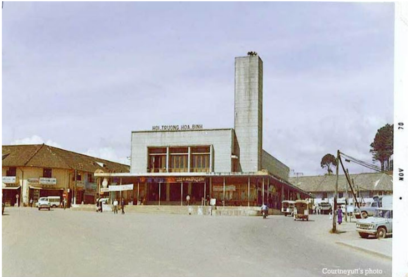
Hoa Binh "convention center," see how quiet and empty the streets are in 1970